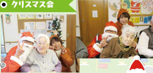
サンタさんと トナカイさん登場に 思わずニコリ笑顔😊