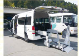
ピカピカの送迎車でお迎えに参ります