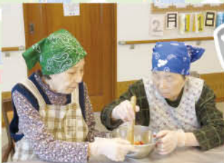
協力し合っ ホットケーキを作りました。 トッピングも上手にできて、 「あ〜ん」。さて、お味は?