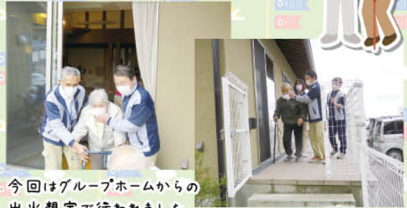
今回はグループホームからの 出火想定で行われました。 一生懸命に取り組まれました。