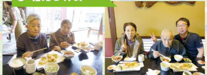
今日の昼食は「矢車」さんと天ぷら定食。目の前で揚げていただいた天ぷら😊 さくさくおいしく皆様完食です。 桜の下でハイチーズ! 少し寒かったけどあまりのきれいに寒さも忘れしました。