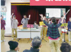
初めてされる楽器にウキウキ、ドキドキ◎「私、指揮やったことあるんや」と、さすが手つきが様になっていました!!