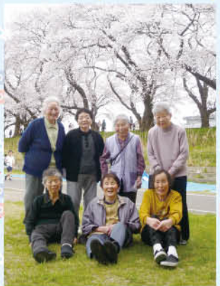
今年もきれいに咲いた桜を堪能しました。心がほっとあたたまりますね。