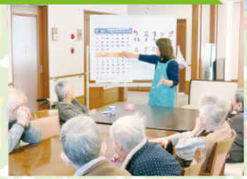
皆さん真剣に聞いてまーす。