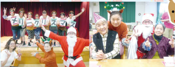
サンタからのクリスマスカードをプレゼントされにっこりです。職員のとんチャイム演奏に聞き入り、スーダラ節のダンスに大笑いしました☺