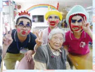
久しぶりのお化粧に、「はずかしいわぁ」。職員も利用者様に化粧??していただき、きれいな顔(笑)に仕上げてもらいました。