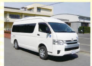
乗り心地もよくなりました