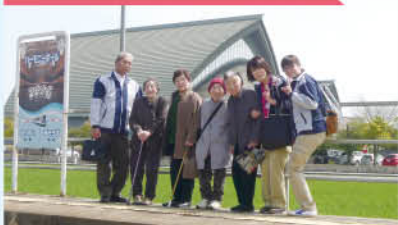
今年も行ってきました“電車で駅前ツアー”!! 福井駅の変わりよう皆様驚かされていました。