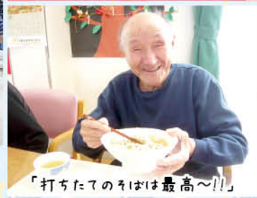
「打ちたてのそばは最高〜!!」