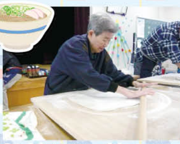
「若い頃は手打ちで作ってたのよ」と手際良く作業されていました。