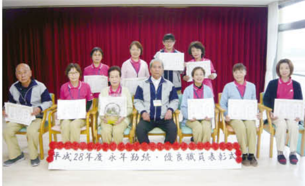
今年度は永年勤続職員8名、優良職員7名が表彰されました。表彰された皆様おめでとうございます。