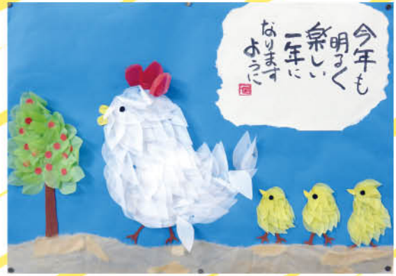
宇野 マツイ様 T10.11.1