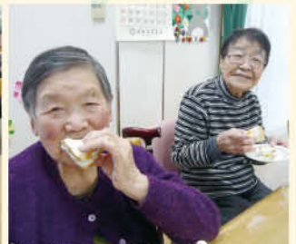
選択メニューやパンメニューも大好評!