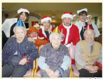
サンタとトナカイとの記念撮影。 いい笑顔ですわね。