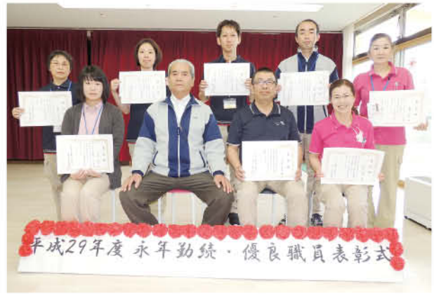
平成29年度永年勤続・優良職員表彰式

今年度は永年勤続職員5名(20年1名、10年4名)、 優良職員6名が表彰されました。