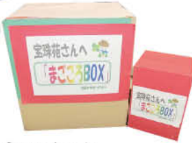
心のコもった“まごころBOX”をいただきました。