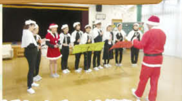
職員によるトーンチャイム演奏♪ “きよこの夜”を和音で演奏し、なかなかのハマリでした。