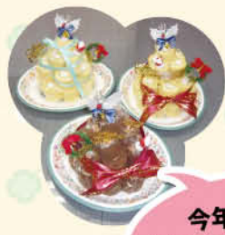
今年のクリスマスケーキは タワー型に盛り付け♡