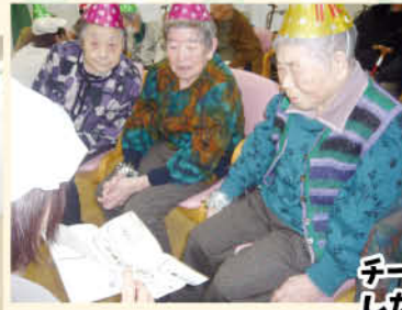
チーム全員で協力しながら地図を解説し宝を目指します!