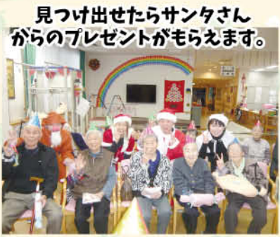
見つけ出せたらサンタさんからのプレゼントがもらえます。