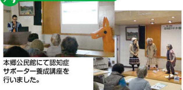
本郷公民館にて認知症サポーター養成講座を行いました。