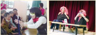
マジックショー、二人羽織等で 大変盛り上がりました!