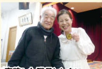
変装した職員とともに 記念撮影です。