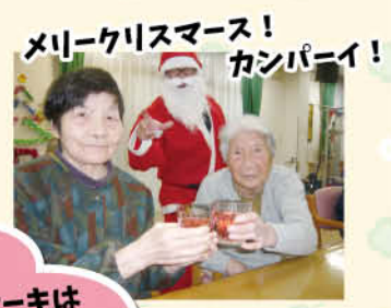
メリークリスマス! カンパニー!