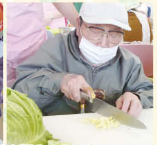
たこ焼き作りでも腕を振りました。