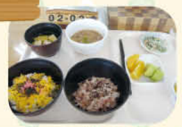
食事を楽しんで頂こうと いろいろと新たな 取り組みに挑戦!!