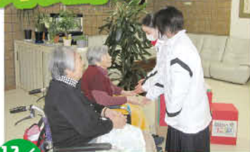
12/8 川西中学校ボランティアの訪問